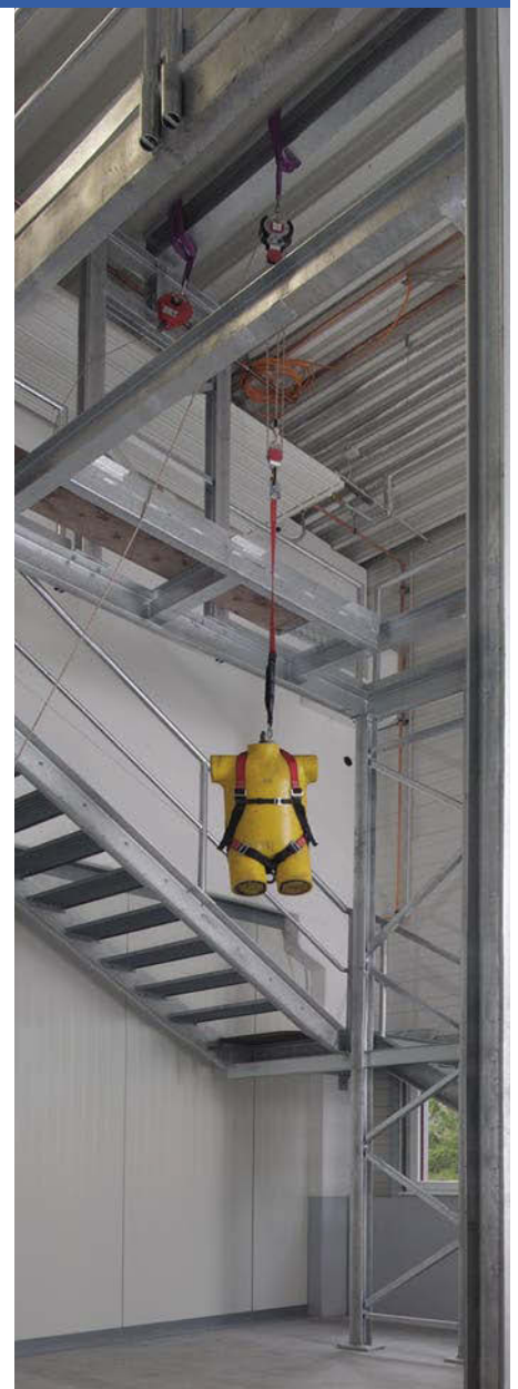
Prüfstand für Absturzsicherung bei MAS